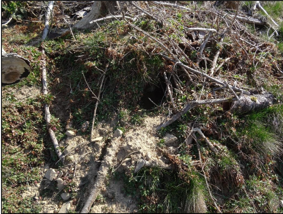
Abbildung 2: Versuch einer älteren Grabung