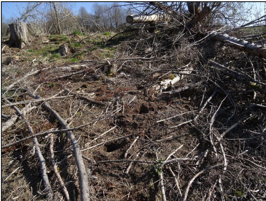
Abbildung 3: Dachslatrinen